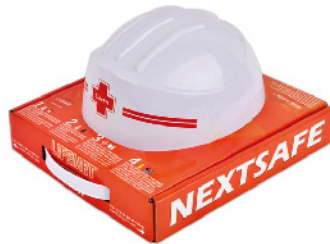
Model: 라이프멧 표준형 재난대응키트/이지캐리어