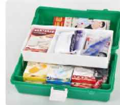
Model: F-PROPC180 전문가용 고강도 중형 2단 트레이 응급키트