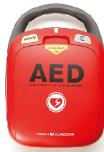
Model: AED HR-501 ₩1,700,000