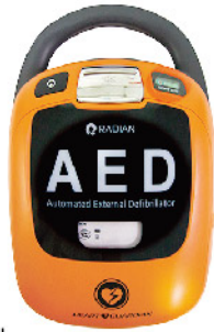
Model: AED HR-503 ₩2,200,000