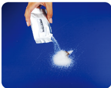
Model: Fluid Solidfier PackSCAR 고체화 오염처리제 / 10PCS