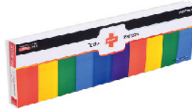
Model: F-GIF 6.5 프로모션용 4단 레인보우 응급키트