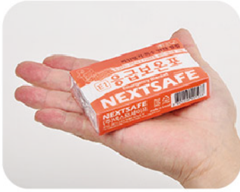
Model: 비상용보온포 자기체온보호 97% / 초박형포장 비산방지 특수필름사용 (유해물질제거) 한국제조

넥스트세이프만의 초박형 기술이 접목된 재난상황별 체온보호를 목적으로 개발된 휴대성과 기본기능에 충실한 비상안전용품입니다.