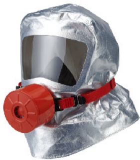
Model: SCA119FN 화재용긴급대피마스크 유독가스15분이상차단 안면보호렌즈