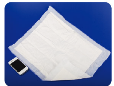
Model: Disposable clean-up towels 오염물흡착타월 / 10PCS