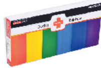
Model: F-GIF 5.0 프로모션용 3단 레인보우 응급키트