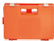
Model: CASE-WB 38 전문가용 고강도