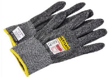
Model: 재난절단 방지장갑 재난파편 손상방지처리 EN388 level3 (배임방지품질승인)