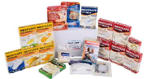
Model: MASTER Refill pack 마스터 리필팩/19종 ₩69,000