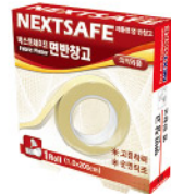
Model: FABRIC PLASTER 면반창고/1ROLL 영반창고 ₩2,000