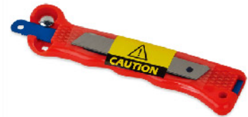
Model: 비상용 칼/쇠톱세트 금속/플라스틱 절단용 초소형 톱 칼날