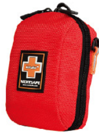
Model: F-GIF 19 프로모션용 3단 레인보우 응급키트