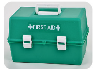
Model: CASE-TR 60 전문가용 고강도