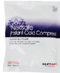
Model: ICEPACK 3 일회용 응급 아이스팩 골드