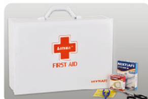
Model: F-SAC30 안전시설용 25인용 금속 캐비닛 응급키트