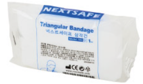
Model: TRIBAND 2 일회용 응급 삼각건