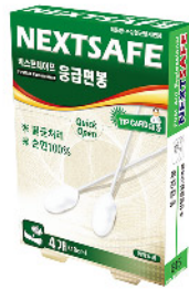
Model: FIRSTAID COTTON SWA 응급면봉/4PCS 수성멸균탈지면봉 ₩3,000