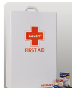
Model: F-SAC55 안전시설용 50인용 금속 캐비닛 응급키트