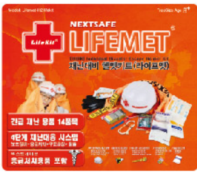
Model: 라이프에듀 교육/체험용 재난대응키트

재난초기 현실적 대응이 가능한 핵심용품으로 구성되어 경제적인 비용으로 모든 국민이 재난에 대처할 수 있는 보급용 재난대비용 키트입니다.