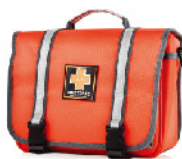
Model: F-PROB70 소형 / 전문가용 / 팀 인솔용 응급키트 응급처치용품포함