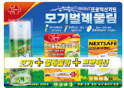
Model: 프로텍션키트 모기피피제, 벌레물림연고 흉터예방밴드