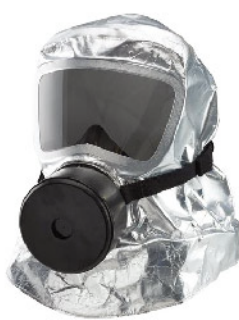
Model: SCA123NF 화재및화생방용 긴급대피마스크 유독가스15분이상차단 안면보호렌즈