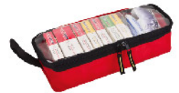
Model: E-RESC 58 전문가용 폴딩 소프트백 구급구조용응급의료키트