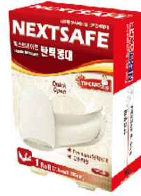
Model: ELASTIC BANDAGE 탄력붕대/1ROLL 동서메디칼고무탄력붕대 ₩3,000