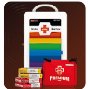
Model: F-PC128 최고급형 대형 케이스 레인보우시스템 / 포타블랙