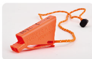
Model: 비상용방수호루라기/B타입 이중음파발생/청력보호/방수 수면기능/구조요청방법표시