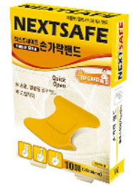
Model: FINGER STRIP 손가락 밴드/10PCS 엘라스티에스밴드 ₩3,000