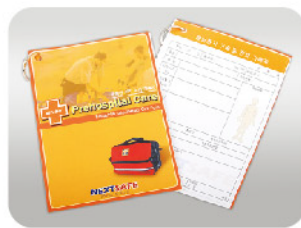
Model: CON-ERNOTE 3 응급처치 기록카드