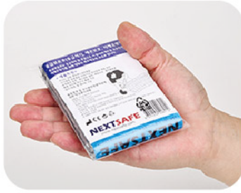
Model: 비상용보온판쉴우의 우천시 완전방수/체온보호/초박형포장 비산방지 특수필름사용 (유해물질제거) 한국제조