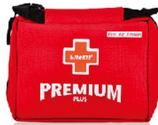
Model: F-GIF 29 프로모션용 고급 플딩 중형 응급키트