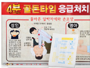
Model: CON-CPRBRO 3 4분골든타임 응급처치 브로마이드&CPR페이스 시트

응급 상황에 빠르게 대처할 수 있도록 다양한 응급처치 컨텐츠와 방법, 용품에 대한 정보가 포함되어 있습니다.