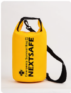
Model: 라이프백 72 Essential 24시간 1인 재난대비 키트 5리터 방수 부이/보호구 탈출/신호/식량식수/응급처치

다양한 재난상황에 대처할 수 있는 전문용품이 탑재된 72시간(3일) 생존키트로 식량 식수를 비롯하여 보호구, 탈출, 위생, 구조요청, 조명, 전기충전등 다양한 실용제품으로 구성된 프리미엄급 재난대비키트 입니다.