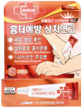
Model: 듀플러스 스카라이트연고 상처보호,흉터완화