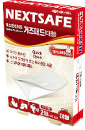
Model: GAUZE PAD-L 거즈패드(대형)/2PCS 에이스패드 ₩3,000