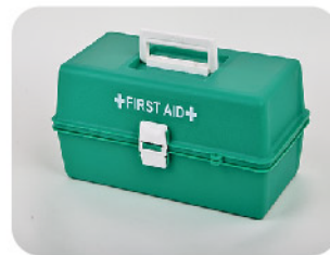
Model: CASE-TR 40 전문가용 고강도