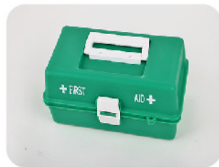
Model: CASE-TR 20 전문가용 고강도