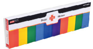
Model: F-GIF 9.0 프로모션용 5단 레인보우 응급키트