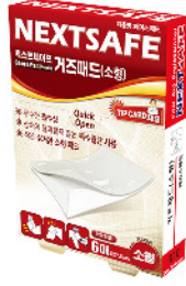
Model: GAUZE PAD-S 거즈패드(소형)/6PCS 에이스패드 ₩3,000