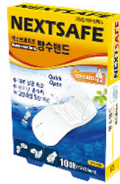
Model: WATERPROOF STRIP 방수밴드/10PCS 에드플렉스 ₩4,000