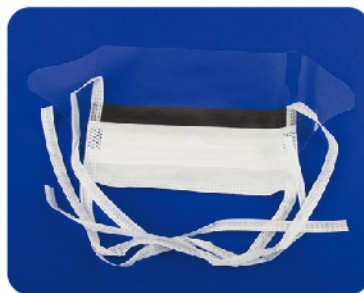
Model: Model:Eye shield mask 안면보호마스크 / 5PCS