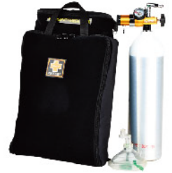
Model: F-AVIATION 140 항공기/여객기/선박용 응급키트