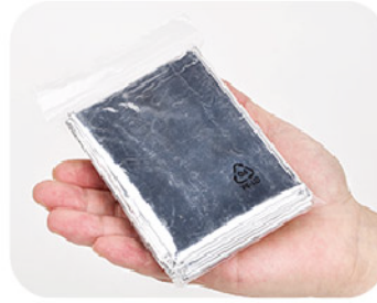
Model: 비상용보온침낭 자기체온보호 97% / 초박형포장 비산방지 특수필름사용 (유해물질제거) 한국제조