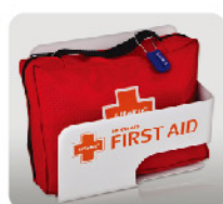
Model: F-SAC12 안전시설용 포타블 금속 응급키트