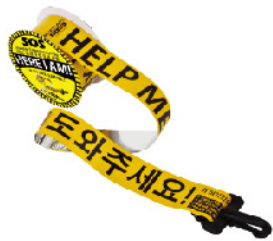
Model: 재난구조요청깃발/롤타입 고층사용가능 30M길이/한글 영어 표기고정용 후크/베어링기능

한국의 특성상 재난시 고층에 고립되는 경우가 많으므로 자신의 위치를 효과적으로 노출 할수 있어야 하며 재난시 전기의 사용이 불가능하기 때문에 상기 조명이 가능하여야합니다.