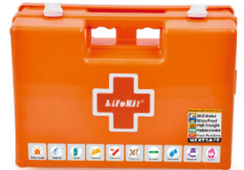
Model: F-PROWC320 의료시설용 대형 월브라켓 응급키트