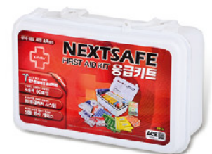
Model: F-COM 28S 편의점,마트 유통용 소프트백 소형