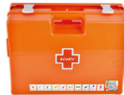
Model: F-PROWC180 의료시설용 중형 월브라켓 응급키트