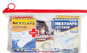
Model: F-COM 14 편의점,마트 유통용 파우치 응급키트