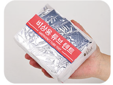
Model: 비상용튜브텐트 비상시 체온보호 / 초박형포장 비산방지 특수필름사용 (유해물질제거) 한국제조