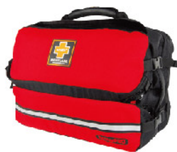
Model: F-PROB240 전문가용 대형 전문구조용 응급키트 응급처치용품포함