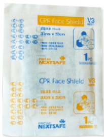
Model: CPR MASK 3 일회용 CPR마스크