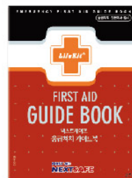
Model: CON-GUIDE 3 응급처치가이드북