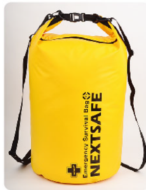
Model: 라이프백 72 Advance 72시간 2~4인 재난대비 키트 방수/30리터 부이/보호구/탈출 신호/통신/식량식수/위생/응급처치