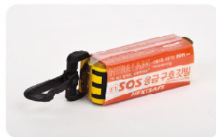
Model: 재난구조요청깃발/스틱타입 고층사용가능 30M길이/한글 영어 표기고정용/후크/초박형포장