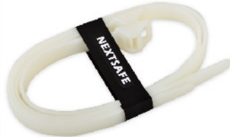
Model: 비상용강력결속선 100kg 이상 내하중/ 주/부 결속선 체결