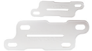
Model: SPRINT 8 교육용 부목세트