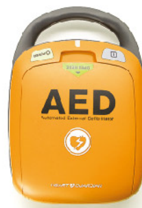
Model: R-501T ₩450,000