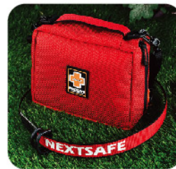
Model: F - PB68 최고급 중형 2~3인용 응급키트 / 폴딩시스템