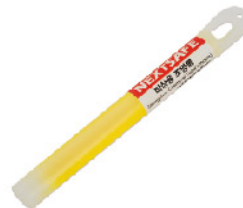
Model: 비상용조명봉/A타입 비상시 꺾으면 조명 구조신호 가능/12시간 발광지속