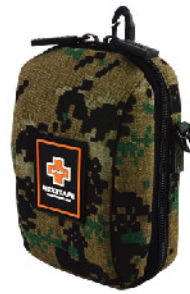
Model: F-GIF 20 프로모션용 4단 레인보우 응급키트