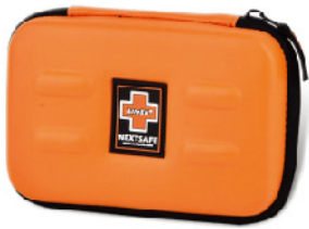
Model: F-EVA 10 프로모션용 고급 소프트사이드 소형