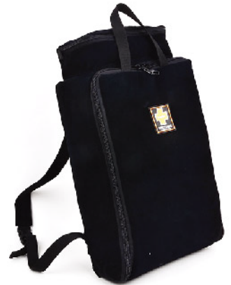
Model: 라이프백 72 VIP 72시간 1인 재난대비 표준 키트 ,방수 20리터 부이/보호구/탈출/신호/통신/식량식수 위생/응급처치/개인관리용품/의약품관리