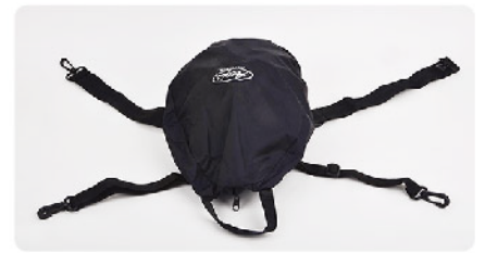
Model: 라이프터틀 의자결속형 재난대응키트