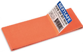
Model: 비상용강력접착테이프 사물을 강력하게 접착 스타터랩

재난은 다양한 변수에 노출되기 마련이고 주변의 사물을 충분히 활용하여야 합니다. 이때 필요한 강력 결속, 강력접착, 강력절단력을 가진 도구는 고립탈출의 필수 요소입니다.