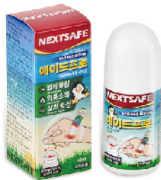
Model: 에이드프로 상처, 소독볼