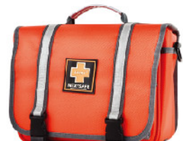
Model: F-PROB190 대형 / 전문가용 / 학교 인솔용 응급키트 응급처치용품포함