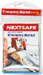
Model: BLANKET-S 4 일회용 응급 보온포 실버