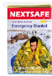
Model: BLANKET-G 5 일회용 응급 보온포 골드