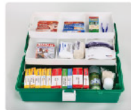
Model: F-PROPC50 전문가용 고강도 소형 1단 트레이 응급키트