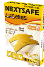
Model: KNUCKIE STRIP 관절 밴드/10PCS 엘라스티에스밴드 ₩3,000