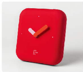
Model: 라이프클락 시계형 재난대응키트