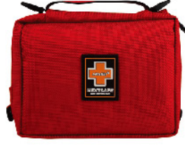
Model: F - PB44 고급 중형 2~3인용 응급키트 / 폴딩시스템