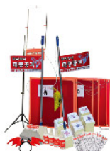
재난체험게임 교보재 세트 풍수해,응급처치,감염,화재