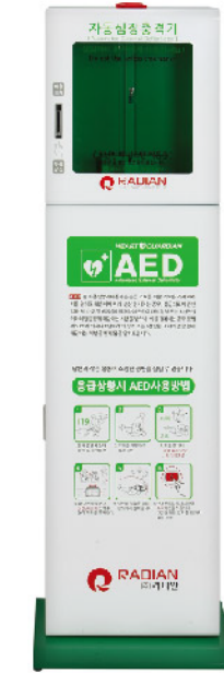
Model: AED 스탠드 보관함 ₩450,000