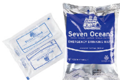
Model: Emergency Drinking Water 3년 이상 보존테스트 완료 국제규격