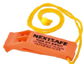
Model: 비상용방수호루라기/A타입 이중음파발생/방수/수면기능 구조요청방법표시