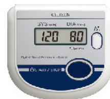
Model: 팔뚝형 혈압계 ₩41,000