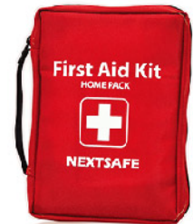
Model: F-GIF 49 프로모션용 고급 플딩 대형 응급키트