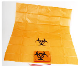
Model: Biohazard bag 오염물처리팩 / 10PCS