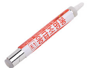
Model: 비상용조명봉/B타입 비상시 꺾으면 조명/구조신호 가능 빛을 모아주는 집광판기능/12시간 발광지속