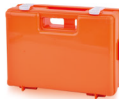
Model: CASE-WB 58 전문가용 고강도