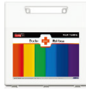
Model: F-PC69 최고급형 대형 케이스 레인보우시스템