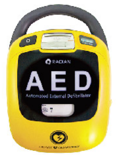
Model: AED HR-503T ₩500,000