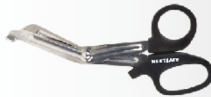
Model: SCISSOR 6 중형 응급가위