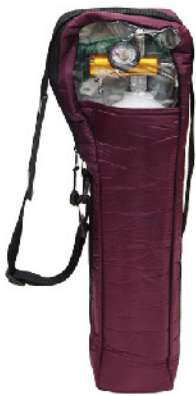
Model: 휴대용 산소호흡기2.8L ₩240,000