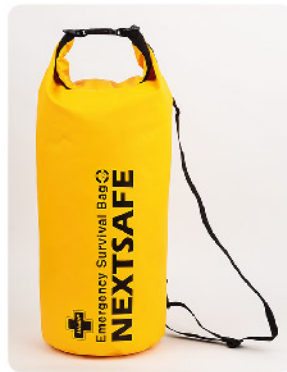
Model: 라이프백 72 Standard 72시간 1인 재난대비 표준 키트 방수/20리터 부이/보호구/탈출 신호/통신/식량식수/위생/응급처치