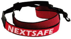
Model: F-GIF 12 초소형 응급키트

고급원단을 사용한 시스템 응급가방/약세사리로 가방 케이스로 구성품을 직접구성할 수 있습니다.(구성품 미포함)