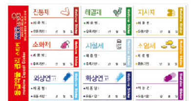
Model: CON-DRSTICK 4 응급약품관리스티커