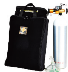
Model: F-PROB800 최고급 VIP의전용 응급키트 응급처치용품포함