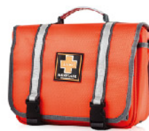
Model: F-PROB100 중형 / 전문가용 / 학급 인솔용 응급키트 응급처치용품포함