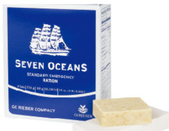
Model: Emergency Ratio 5년 보존테스트 완료 국제규격

비상상황시 장기적인 구호대기가 가능하고 장기보관 및 관리가 용이한 국제규격의 식량식수입니다.