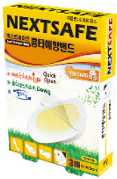
Model: SCAR PREVENT STRIP 흉터예방밴드/3PCS 소마덤에스 ₩4,000