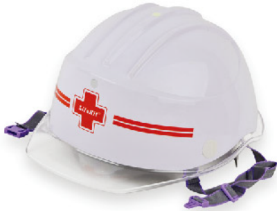
Model: ABE재난헬멧 ABE (낙하,추락,감전) 승인

재난시 첫번째 순서는 자신의 신변을 보호하는 것이며 넥스트세이프는 보다 효과적으로 머리-상체-호흡기-눈-손을 보호할 수 있도록 개발하였습니다.