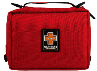
Model: F-GIF 28 프로모션용 5단 레인보우 응급키트