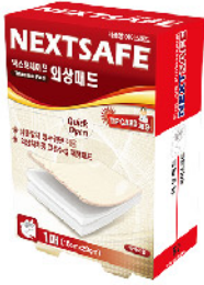
Model: TRAUMA PAD 외상패드/1PCS 에이스패드 ₩5,000

국제규격의 응급처치 가이드스를 준수하였으며 팁카드가 포함되어 올바른 응급처치를 할 수 있는 정보가 수록되었습니다.