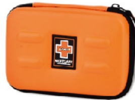
Model: F-EVA 20 프로모션용 고급 소프트사이드 대형