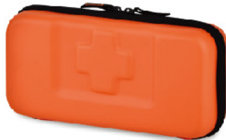
Model: F-EVA 15 프로모션용 고급 소프트사이드 중형