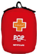
Model: F-GIF 19 프로모션용 고급 플딩 소형 응급키트