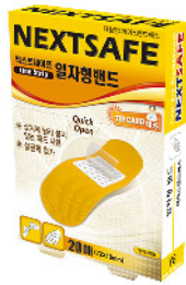
Model: LINE STRIP 일자형 밴드/20PCS 에이스밴드에스 ₩2,000