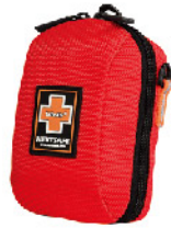
Model: F - PB34 고급 소형 1~2인용 응급키트 / 폴딩시스템

구성품의 수납과 보호는 빠른 처리가 가능한 위치로 밸런싱되었으며 디자인 트렌드에 뒤떨어지지 않도록 넥스트세이프만의 독자 원단으로 6:4비율을 유지하였으며 독립적인 휴대는 물론 타용기와 혼재하는 것이 편리하도록 하였습니다. 모든 어플리케이션과 엑세스리는 비상시 활용할 수 있도록 기본기능과 보조응급 처치로서의 듀얼 기능을 제공합니다.