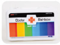
Model: F-PC38 고급형 중형 케이스 레인보우시스템