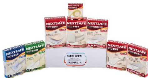
Model: DRESSING Refill pack 드레싱 리필팩/8종 ₩22,000