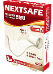
Model: ROLL BANDAGE 면붕대/2ROLL 금광붕대3호 ₩3,000