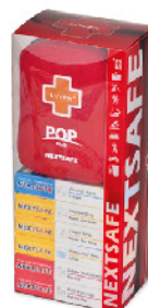
Model: F-COM 28H 편의점,마트 유통용 소형 케이스 응급키트