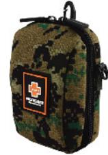
Model: F - PB59 최고급 소형 밀리터리/ 그레이드 / 폴딩시스템