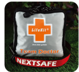
Model: F - PB98 최고급 대형 4~5인용 밀리터리/ 그레이드 / 폴딩시스템