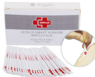
Model: SCRAPER 8 일회용 스크래퍼