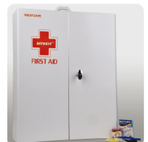
Model: F-SAC100 안전시설용 100인용 금속 캐비닛 응급키트