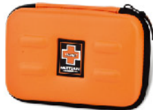
Model: F-EVA 15 프로모션용 고급 소프트사이드 중형