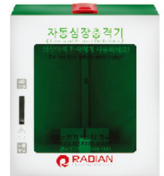
Model: AED 벽걸이 보관함 ₩250,000