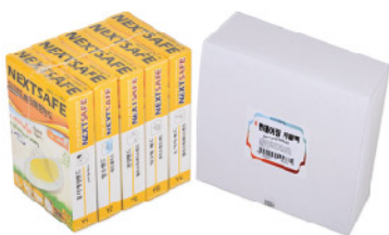
Model: BANDAGING Refill pack 밴데이징 리필팩/6종 ₩14,000