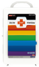
Model: F-PC98 최고급형 대형 케이스 레인보우시스템