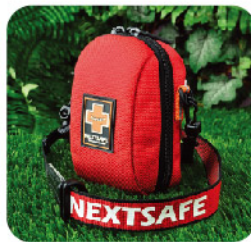
Model: F - PB58 최고급 소형 1~2인용 응급키트 / 폴딩시스템