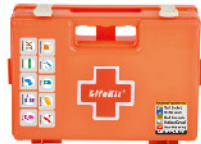
Model: F-PROWC60 의료시설용 소형 월브라켓 응급키트