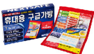
Model: F-COM 12 편의점,마트 유통용 포켓 응급키트