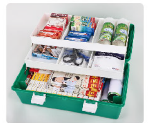
Model: F-PROPC320 전문가용 고강도 대형 2단 트레이 응급키트