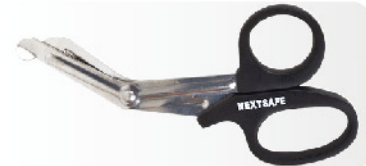
Model: SCISSOR 12 대형 응급가위