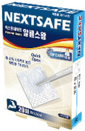
Model: ALCOHOL SWAB 알콜스왐/20PCS 에이스스왐 ₩3,000