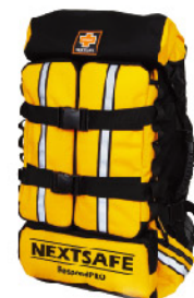
Model: F-PROB580 전문가용 초대형 전문구조용 응급키트 응급처치용품포함