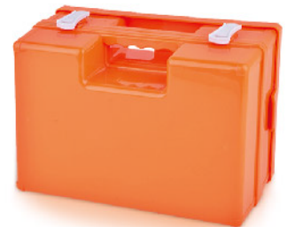
Model: CASE-WB 88 전문가용 고강도