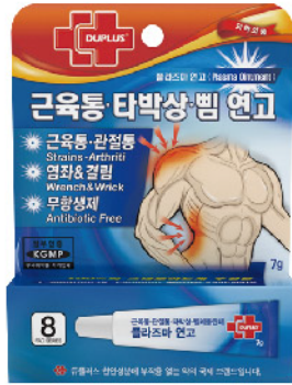
Model: 듀플러스 플라즈마연고 벌레물림,소염진통연고