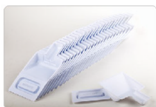
Model: Scoop and scraper 오염물처리스쿠퍼세트 / 24PCS