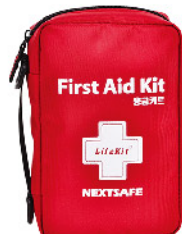
Model: F-GIF 39 프로모션용 고급 심플 중형 응급키트