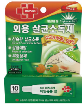
Model: 듀플러스 에틸큐롬겔연고 소독연고