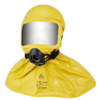
Model: SG1000HC 화재및화생방용 긴급대피마스크 유독가스15분이상차단 안면보호렌즈