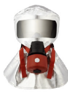
Model: SG-F0119 화재용긴급대피마스크 유독가스15분이상차단 안면보호렌즈