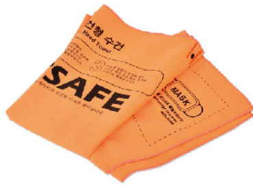
Model: 재난방호 후드수건 상체/안면/목보호용